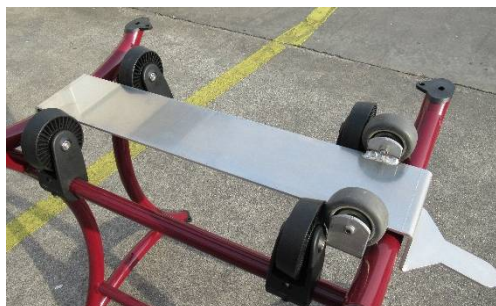
Pedana per inserimento botti