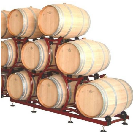
Es. Catasta 3 File 225 Lt