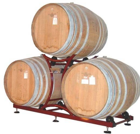
Es. Catasta 2 File 500 Lt