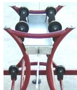
Vaschetta raccogli liquido