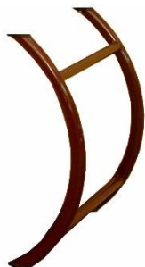
Staffe Laterale per creazione di Cataste "Verticali"