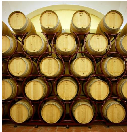
Es. Catasta 5 File 225 Lt